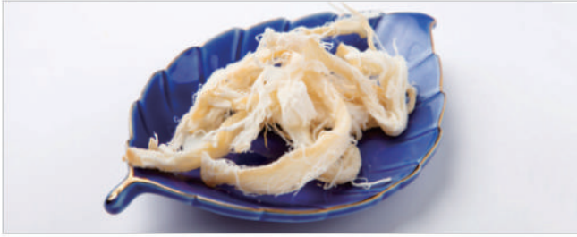
水产干品 · 零食 · 豆类